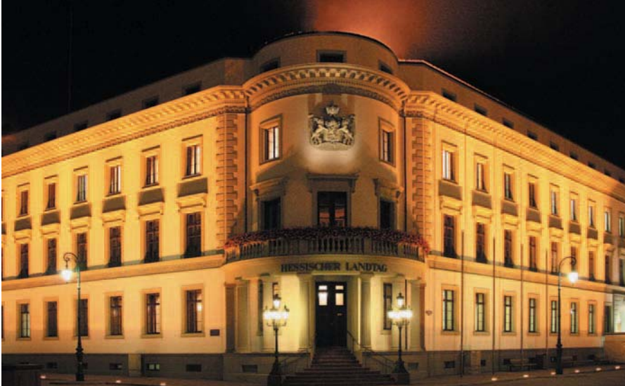
Ort künftiger Verhandlungen – der Hessische Landtag

Der Weg deutscher Linker weg von Gerhard Schröder führte zu sehr ähnlichen Positionen, aber sehr unterschiedlichen Gestaden – einerseits zu neuen Mehrheiten etwa in der SPD Hessens oder Niedersachsens, andererseits in die WASG und zur neuen LINKEN. Beide Versuche, sich von Schröder politisch zu befreien, erzielten Ende Januar bei der Landtagswahl in Hessen zusammen genommen einen Stimmenanteil, wie sie ihn die SPD allein seit Anfang der 80er Jahre nicht mehr erreichen konnte. Doch was wird daraus? Nichts, heißt es. Frau Ypsilanti verspielt ihren Erfolg und ihre Glaubwürdigkeit. Mit dem Programm der LINKEN antreten, es aber auf keinen Fall mit der LINKEN umsetzen wollen – wie lange kann man so etwas ernst nehmen?